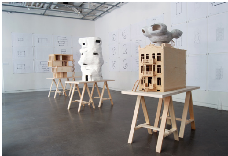
Figure 1. Outsider (vue d'installation), exposition solo présentée à la Maison de l'architecture du Québec du 21 juin 2018 au 30 septembre 2018, Montréal.

des arts à l'architecture, ces projets représentent une recherche sur l'architecture en tant qu'œuvre d'art. La dynamique des volumes et l'ensemble des plans, des coupes et des axonométries qu'ils présentent répondent à une prédilection pour l'amalgame. Chaque prototype est une version du rêve d'habiter qui puise dans les images matérielles (Gaston Bachelard) comme dans les «proto-images» (Jean Dubuffet) que sont la coquille, le cocon, le nid, le terrier. Ces projets reprennent la notion d'«image latente» en architecture, décrite par Bachelard lorsqu'il interroge les rapports entre imaginaire et rationalité. 3 Bachelard reprend les théories jungiennes de l'archétype et du symbole pour s'intéresser, dans La poétique de l'espace (1957), aux images poétiques de la maison. 4 Ces images poétiques sont les images latentes qui illustrent, sous leurs formes élémentaires, la fonction d'habiter. C'est le cas, par exemple de la spirale, de la grotte et de la coquille.