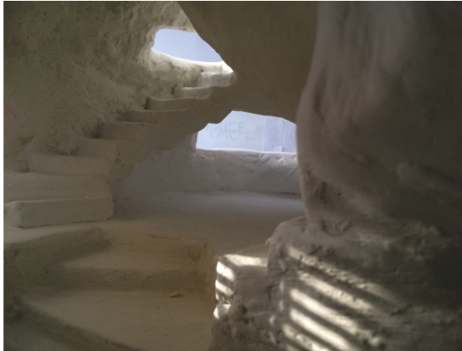
Figure 3. Tour , 2018, maquette (à l'échelle 1:20) et dessins (1:40, 1:50), plâtre, polystyrène, bois et impression jet d'encre, Outsider (détail), Montréal.

une des premières pistes chronologiques entre la «haute culture» et les pratiques qui se développent hors de toute culture. Jean-Clarence Lambert écrit au sujet du refus de l'autorité en art qu'il est un «anticulturalisme» qui prépare celui de Cobra, comme il rejoint celui de Dubuffet. 14 Lambert relève une étape importante dans la formation de Cobra, lorsqu'en 1945, le manifeste du Nouveau Réalisme est adressé au MoMA de New York notamment signé par Asger Jorn. Jorn s'écarte de l'«art brut qui l'intéresse, en ce qu'il s'approprie des formes diverses et dévalorisées pour les transmuter». 15 Il a vu la nécessité de construire des maisons fascinantes dans lesquelles «le rôle unique de l'architecture est de servir les passions humaines». 16 La maison devait être «une machine visant à choquer, à fasciner, une machine relevant l'humain et l'expression universelle. C'est la nouvelle architecture». 17 À ce propos, Jorn a écrit à l'artiste peintre nucléariste 18 italien Enrico Baj